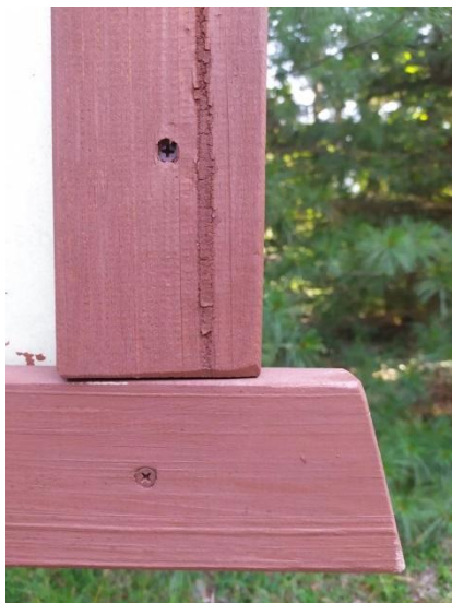
Ryc. 1. Rama tablicy

3.4. Po usunięciu istniejącej tablicy przez Wykonawcę, nowa tablica przytwierdzona powinna być po włożeniu w ramę do istniejącego stelaża o wymiarach 200 x 100 cm, na wysokości ok. 70 cm. Istniejąca konstrukcja zapewnia usztywnienie tablicy, uniemożliwiając falowanie płyty (rycina 1, 2). Wskazana wizja lokalna i ocena możliwości usunięcia starej tablicy bez uszkodzenia istniejącej ramy.