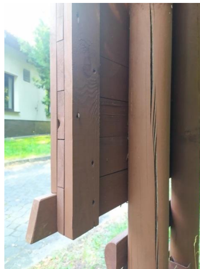
Ryc. 2. Widok boku ramy i pleców tablicy